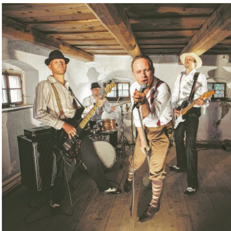
Bringen ihr Debüt-Album heraus: Die Verwegenen.

Beim Quartett aus Bad Hall, Linz-Land und Linz ist der Name Programm: Lyrics müssen nicht „lala“ sein und auch beim Sound darf es in punkto Energie getrost etwas mehr sein. Ein glücklicher Zufall brachte die vier Musiker im Sommer 2003 für ein Fest und einen Song zusammen. Gepröbt wurde zwar vorher schon unterm selben Dach – in einem gepachteten alten Bauernhof in Neuhofen. Aber erst