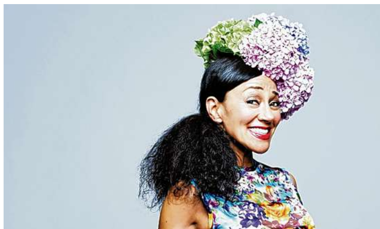
Die portugiesische Jazz-Sängerin ist im Februar in OÖ zu Gast.

i Die OÖNachrichten verlosen 5x2 Tickets für Linz auf nachrichten.at/gewinnspiele !