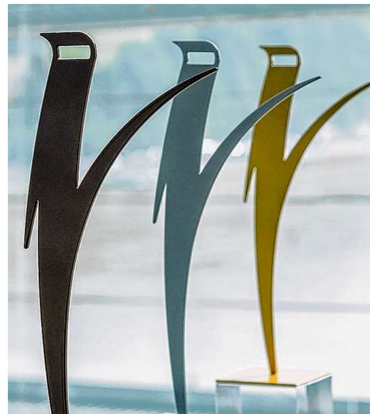
Diese Trophäe wartet auf die Gewinner des EDISON.

i Alle Ideen können bis 28. Februar eingereicht werden. Weitere Informationen über den genauen Ablauf und Kontaktdaten finden Sie auf www.edison-der-preis.at