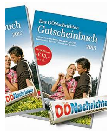
Ihr Vorteil mit den OÖN!

Mit dem OÖN-Gutscheinbuch sind Sie als treue Leser immer bestens versorgt, wenn es um Urlaub, Freizeit und Genuss geht. Nutzen Sie mehr als 240 Vorteile für Ihren Urlaub in einem der tollen Hotels in Österreich, für ein schickes Abendessen in einem der ausgewählten Restaurants oder für eines der aufregenden Freizeitangebote wie einen Besuch in den Salzwerken, im Museum oder auf dem Donauschiff. Viele weitere attraktive Vorteile gibt es obendrein.