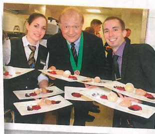
Der Chef des Hauses beim Besuch in der Küche